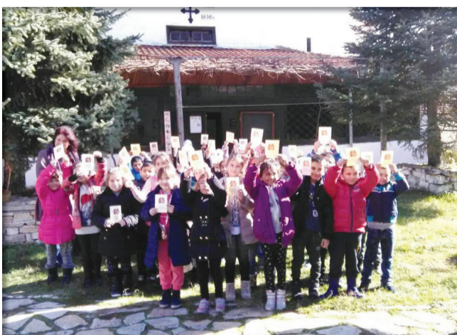
2018 г.- посещение на манастира „Света Троица“ от учениците от първи клас по повод Деня на християнското семейство