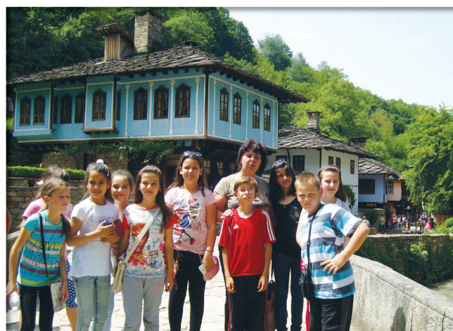
2017 г. - екскурзия