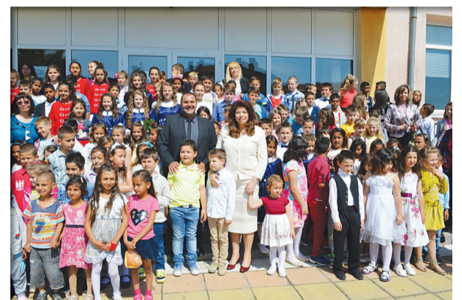
май 2017 г.- посещение на г-жа Илияна Йотова - Вицепрезидент на Република България