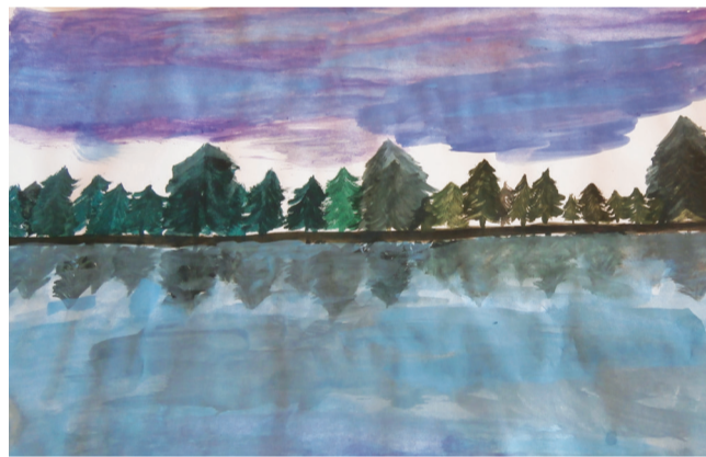
Ангел Коларов - 4 б клас