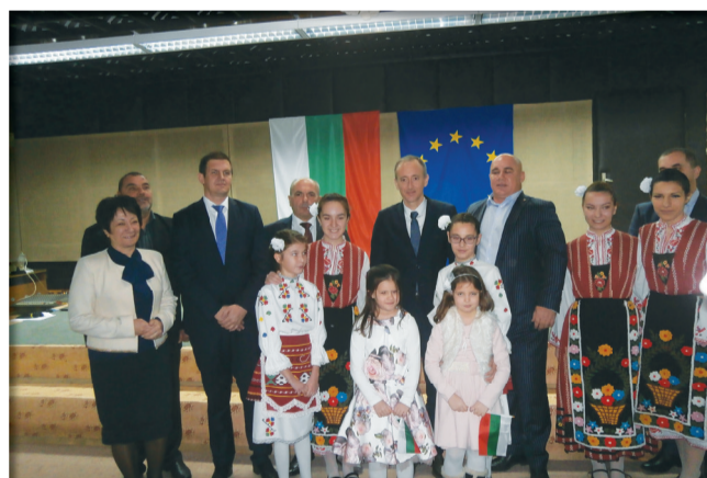
2018 г. - посещение на г-н Красимир Вълчев, министър на образованието и науката