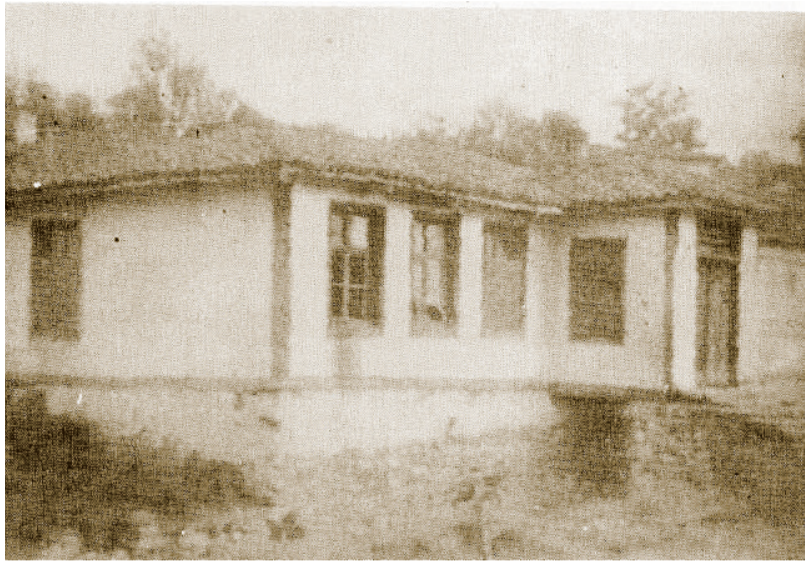
Начално училище до църквата "Св. Илия"