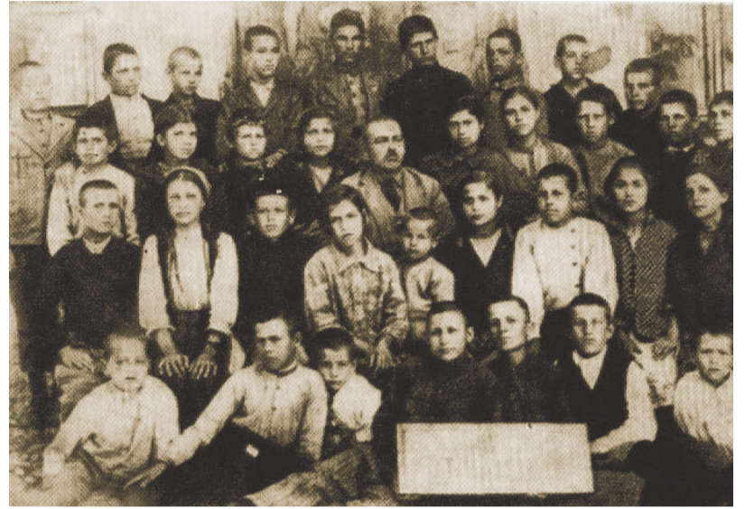
Ученици от централното училище в Каваклий - 1928 г.